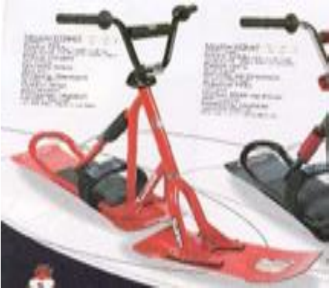
SNOWSCOOT INSANE TOYS AVEL_624_91_I