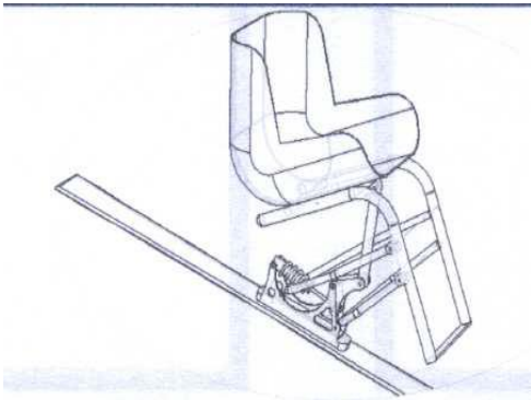
CONCEPT SKI 1 Uniski AVMH_733_99_B