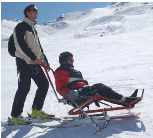
GMS Avis AVMH_749_99_B