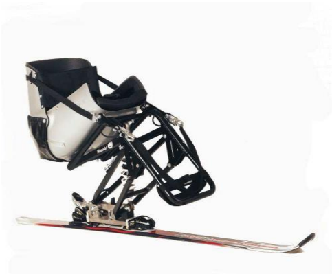
PRASCHBERGER Uniski AVMH_778_07_A