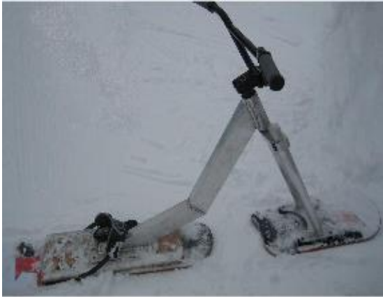
R PURE AVEL_828_14_A