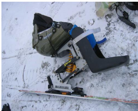
SCARVER Uniski Biski AVMH_779_08_C