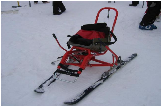
KARTSKI Skikart AVMH_777_06_B