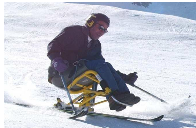
UNISKI Uniski AVMH_735_99_D