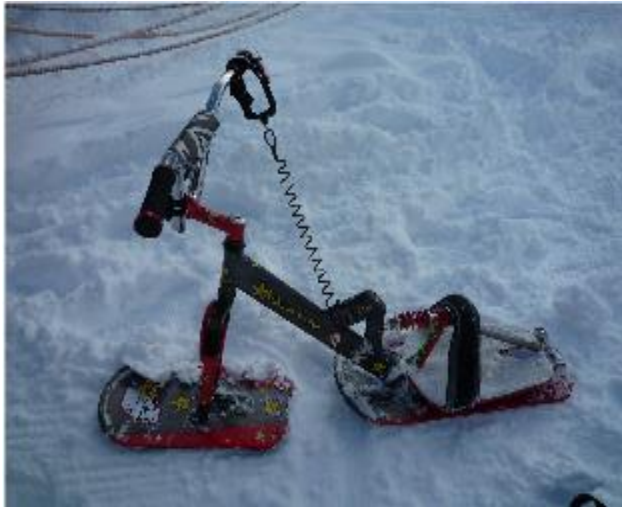
COOL SEVEN AVEL_829_14_A