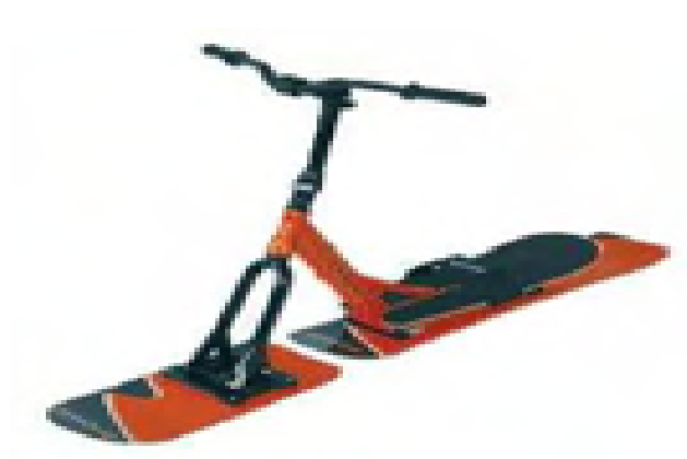
BIKEBOARD SNOW SICNOMEN AVEL_790_06_B