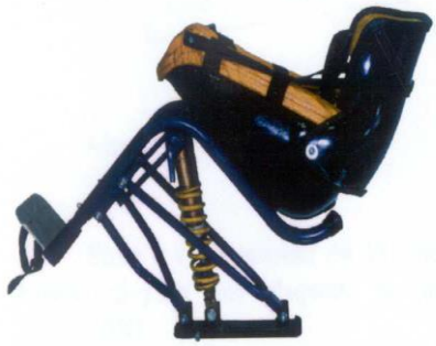
YETI M.C.P. Uniski AVMH_773_01_B