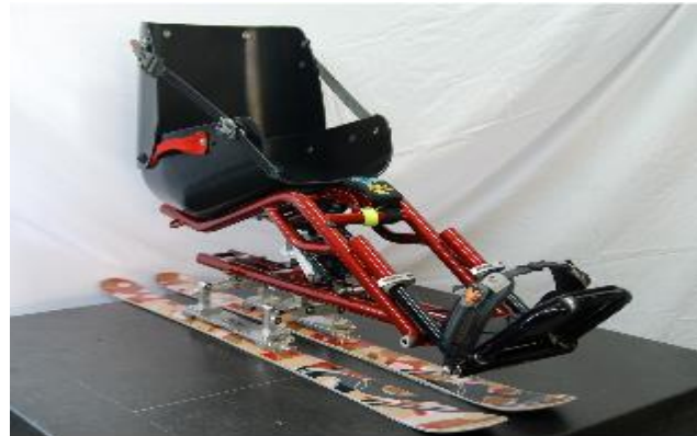
GLIDE Avis AVMH_791_12_A