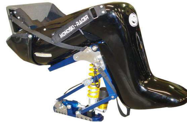
PRASCHBERGER BULLET Uniski AVMH_789_11_A