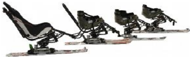
TEMPO Avis AVMH_792_13_B