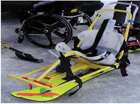
BI UNIQUE Biski AVMH_776_03_B