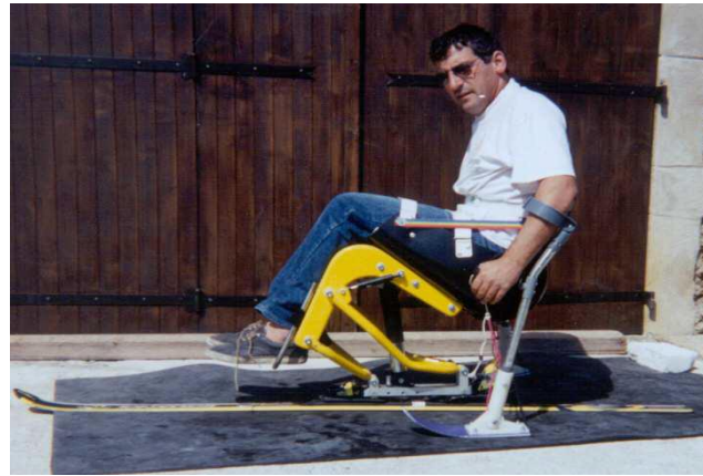
UNISKI AMS Uniski AVMH_748_99_B