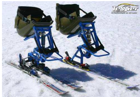
VFC DUALSKI Biski AVMH_775_02_B