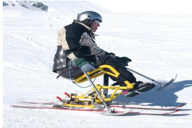
DUALSKI Biski AVMH_735_99_D