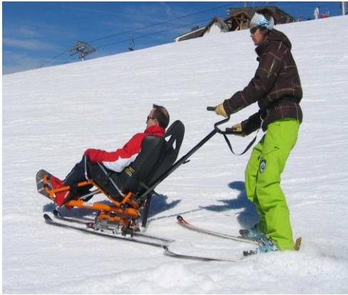
FMS Biski AVMH_783_08_A